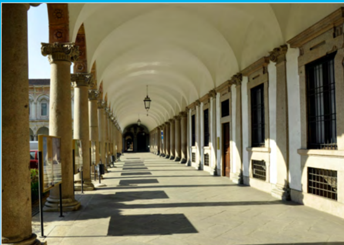
Milano - Il Chiostro dell'Università Statale

INFORMAZIONI PRATICHE PER CONDOMINI E INQUILINI